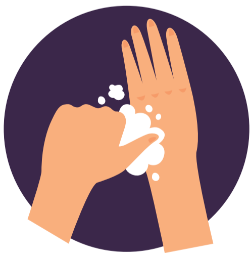
Atención a pulgares