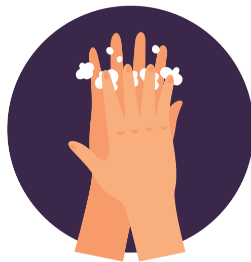
Entre los dedos