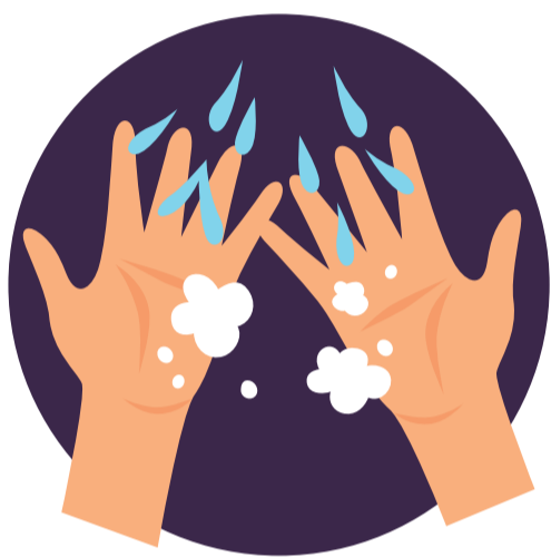
Agua y jabón